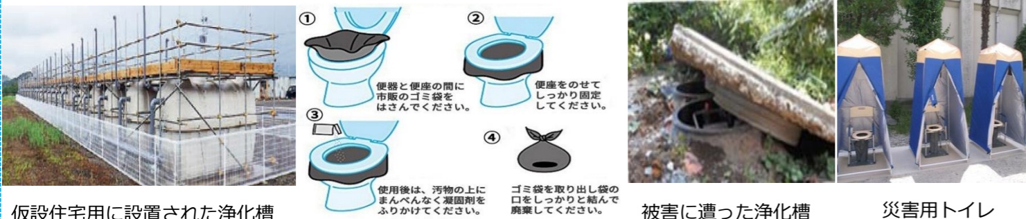
仮設住宅用に設置された浄化槽

排泄は我慢のできない生理現象です。しかし、水洗トイレも使えない・仮設トイレも来ない避難所ではトイレが大小便の山となり、トイレに行くのが嫌になり水分や食事の摂取を控えた為、脱水症状やエコノミー症候群が危惧され、実際にそのような方が大勢いらしたようです。