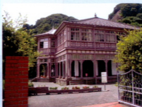
▲紡績所技師館・呉人館