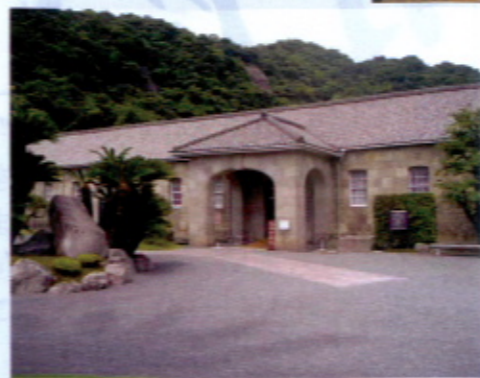
▲機械工場・現尚古集成館

この産業革命遺産は九州、山口など8県11市にまたがり、そのうち、鹿児島市には「旧集成館」、「寺山炭窯跡」、「関吉の疎水溝」の3つの構成遺産があります。