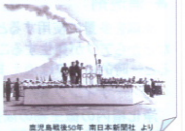
鹿児島戦後50年 南日本新聞社より

2020年のオリンピック開催地に東京が決まりました。皆さまは、昭和39年の東京オリンピックのことは覚えておいででしょうか?昭和39年9月9日10時頃、当時の鹿児島空港(鴨池空港)に「聖火」が到着しました。アジア12か国を経て、まだ当時、復帰前の沖縄より「YS11」にて本土に初めて聖火が到着しました。3日間で60万人の人出があったということです。先日、旧鴨池空港ビルとのお別れイベントがあり、地域の方々が精力的にボランティアで運営されていました。様々な地域で様々な人が、自分にできる地域振興活動をされておいでですね。