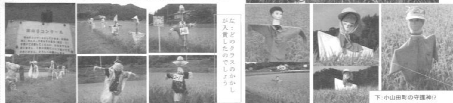
が左: どのクラスのかかし

秋のお米の収穫の季節に、私たちの代わりに大切な稲穂を守ってくれる「かかし」。地域で見つけた様々なかかしを撮影しました。小学校の授業でかかしをつくっているらしきものも見つけました。小学生がかかし製作にかかわるって素敵ですね。(持ち主がわかりかねましたので悪しからずお許し下さい)