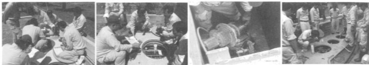
5/30アムズ社製新型(CXN)槽の構造勉強会

新しく設置される浄化槽はメーカーの技術開発によりどんどんその機能やしくみが高度化しています。サービスをご提供させていただき社員全員で、時間をつくって新しい製品へ対応すべく勉強会も適宜行います。