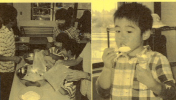
▲ 手作りジェラート体験 うーん、うまい・あまい・うまい！