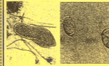
パラメシウム ポルティセラ

強酸性・強アルカリ性・塩素系と書いてある洗剤を 規定量より多く使わないようにしましょう! 使用の場合は、 適正量のみ にして下さい。