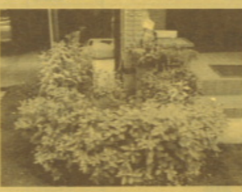
▲ 伊集院町 坂口さま邸