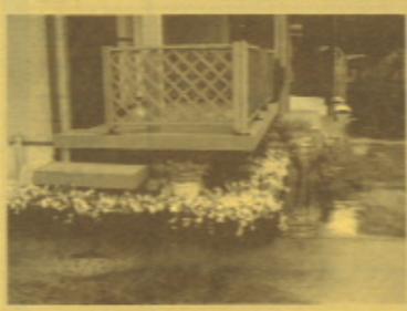
▲ 伊集院町 柿内さま邸