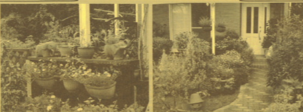
▲ 香山市 漆平さま邸 (右上・左上・右上)