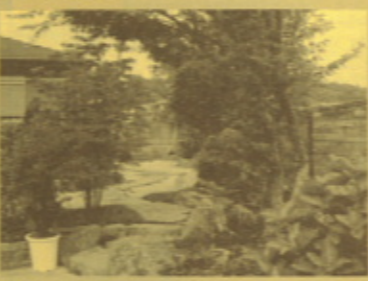
▲ 伊集院町 大中原さま邸