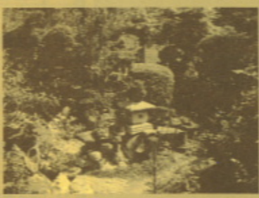
▲ 石谷町 神戸さま邸