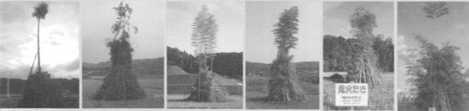
伊集院郡地区 伊集院清藤地区 郡山郡山地区 郡山西俣地区 郡山川田地区 鹿児島中山地区

私たちの住む鹿児島には、様々な地域の伝統行事を語り継ぎ、地域の風習や文化を守っておいでの先輩方がおいでです。地域の鬼火焚きのやぐらを撮影しましたのでご高覧ください。作るに至るまで会議、早朝から集合しくみ上げ、終わった後の後片付けや掃除をするまでの方々を想像してください。地域文化を守っておいでの方々に敬意を表しますとともに御礼申し上げます。